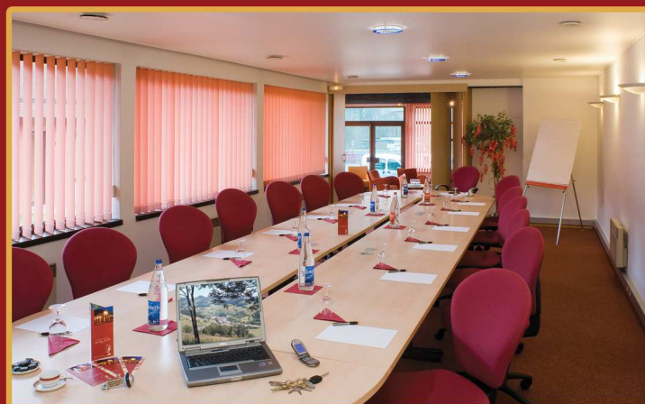
Salle de réunion de 26 places avec équipement complet : vidéoprojecteur et écran, paperboard... Forfait location de salle, journée ou résidentiel.