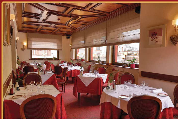
Un restaurant de 80 couverts. Cuisine de terroir raffinée.