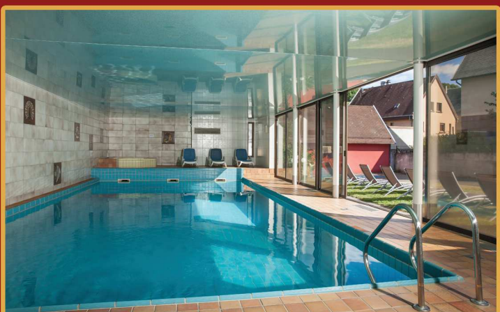
Un espace forme, un sauna, un hammam, jacuzzi et une piscine couverte chauffée.

Elles sont toutes équipées de TV écran plat, satellite, minibar, sèche-cheveux.