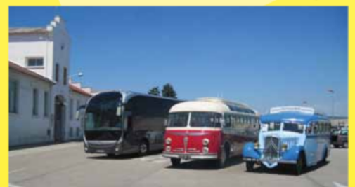
... Prélude à Magelys