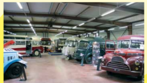
Une belle lignée ...