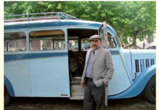
Le P32 ... une star de cinéma

(Visites spéciales pour les scolaires de tous niveaux : nous consulter).