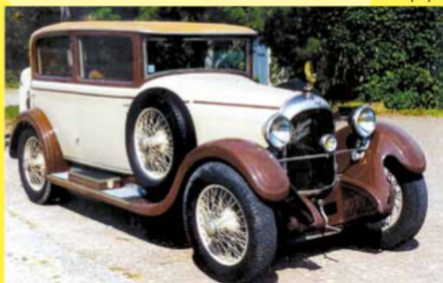
Rolland Pilain - 1929