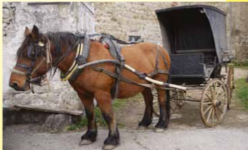
Calèche de la Belle Époque