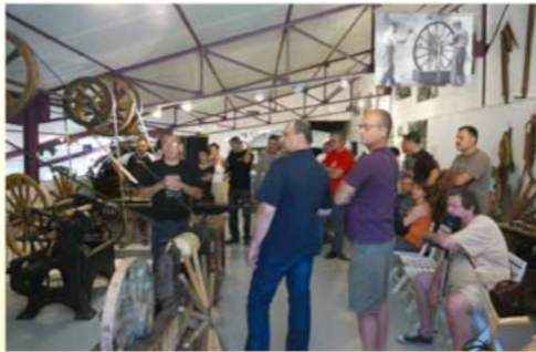
Un point fort : la visite guidée