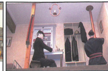
Une chambrée en 1900